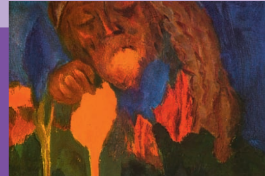
Emil Nolde 1940: Der große Gärtner (Bildausschnitt)

Organisationsentwicklung im Kirchenkreis Burgdorf